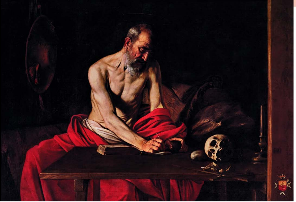
圖／卡拉瓦喬 (Michelangelo Merisi da Caravaggio)，〈寫作的聖耶柔米〉，馬爾他聖約翰大教堂收藏，約 1607-1608 年，油彩畫布，112 × 157 cm。

你曾聽過牧師講道時說「這個字在聖經原文中，意思如何如何」嗎？如果有，你聽到的，可是來自西元四世紀耶柔米的回響！