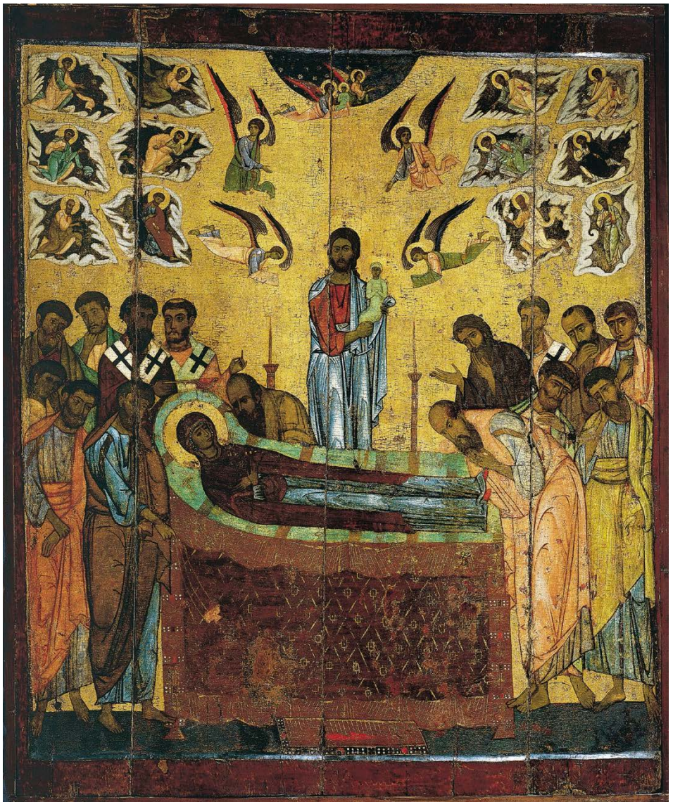
圖／佚名，〈聖母安息長眠〉，俄國 Tretyakov Gallery 收藏，約 1200 年代，木板蛋彩畫，155 × 128 cm， https://my.tretyakov.ru/app/masterpiece/8757 。